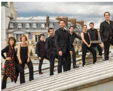
L'Escadron volant de la reine