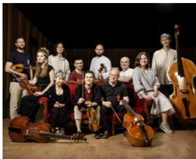
The Beggar's Ensemble